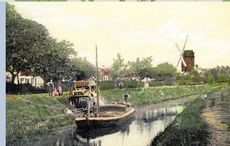
De Langelede circa 1900. Op de voorgrond zie je hoe een schip geladen wordt met zand. De houten molen bestaat helaas niet meer.

Deze waterloop is terug te brengen tot in het 1e kwart van de 14e eeuw. De benedenloop, tussen Moervaart en Groenstraat, werd gegraven in de bedding van de natuurlijke waterloop de Voortbeek of de Watergank, die zijn oorsprong vond op het huidige Arcelor Mittal terrein. De afwatering van het noordelijke deel van de Langelede gebeurde richting Westerschelde. Beide stukken werden, meer dan vermoedelijk door de Marquetteabdij, verbonden en aangepast, met als doel het noordelijk gelegen moergebied te verbinden met de Moervaart. Zo kon de turf, ontgonnen door deze abdij, (die helaas volledig verdwenen is) vervoerd worden via het water.